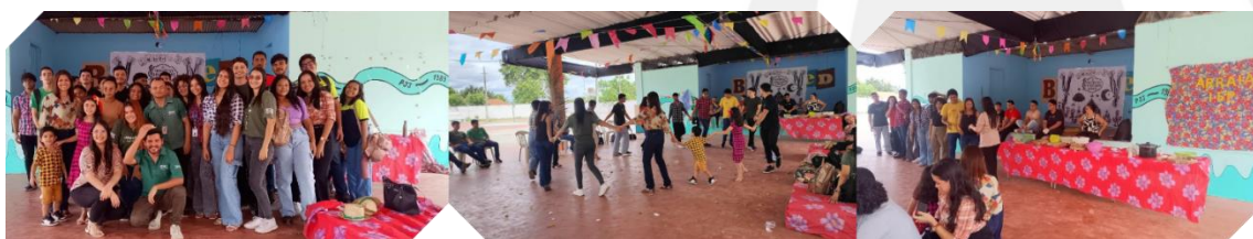
Fotos: Arraia do IEP com os alunos de Pacajus.

A iniciativa fortaleceu os laços entre equipe e educandos, promovendo um ambiente acolhedor, participativo e alinhado aos valores do IEP.