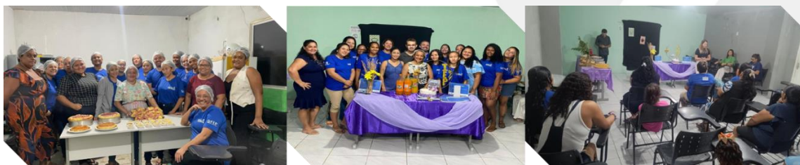
Fotos: Formação do curso.

A FEP, IEP, BEACH PARK HOTÉIS E TURISMO S/A e a PREFEITURA DE AQUIRAZ, acreditam que capacitar as pessoas é possibilitar o seu desenvolvimento, engajamento e motivação, oportunizando melhorias nos resultados da organização e na vida profissional dos educandos.