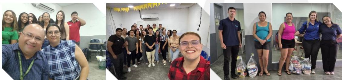
Fotos: Arraial IEP Morada Nova e entrega de cestas básicas.

prática direta em identificação de necessidades sociais, organização comunitária e distribuição humanitária. Tal engajamento vai além da teoria em sala de aula, capacitando-os a compreender de perto as dinâmicas sociais e as vulnerabilidades enfrentadas por parte da população, ao mesmo tempo em que desenvolvem habilidades cruciais como liderança, empatia e trabalho em equipe. Além desta ação solidária, as turmas realizaram o arraial IEP objetivando um maior entrosamento entre os educandos, promovendo a integração social, a valorização das tradições culturais locais e a construção de vínculos. As ações refletiram o compromisso do IEP não apenas com a formação técnica de seus educandos, mas também com o desenvolvimento de uma consciência social, espírito de solidariedade, engajamento e criação de vínculos.