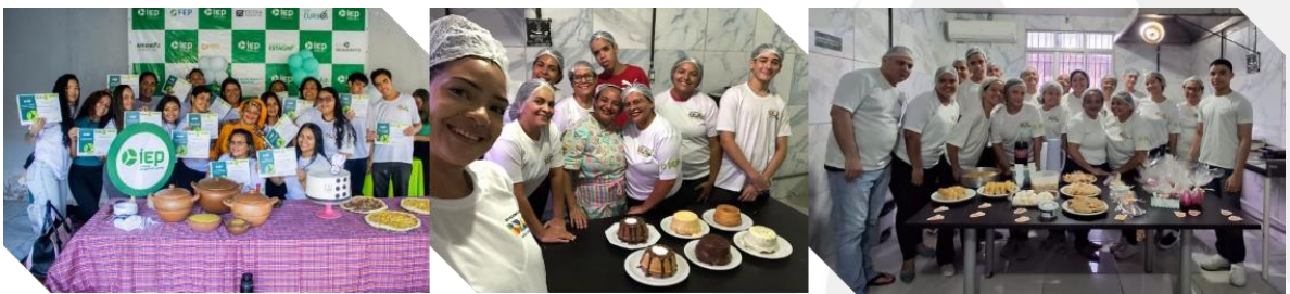
Fotos: Curso de Cozinha Regional Cearense.