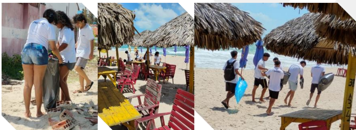
Fotos: Limpeza de praia em Aquiraz.

Mais do que uma ação ambiental, a atividade representou um exercício de cidadania, consciência e responsabilidade socioambiental — valores essenciais para a formação dos futuros profissionais.