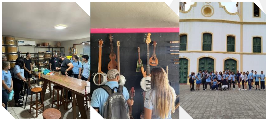
Fotos: Visita ao Centro Histórico de Aquiraz.

O guiamento a pé permitiu uma conexão mais sensível com o território, facilitando a observação, a escuta e a interpretação histórica.