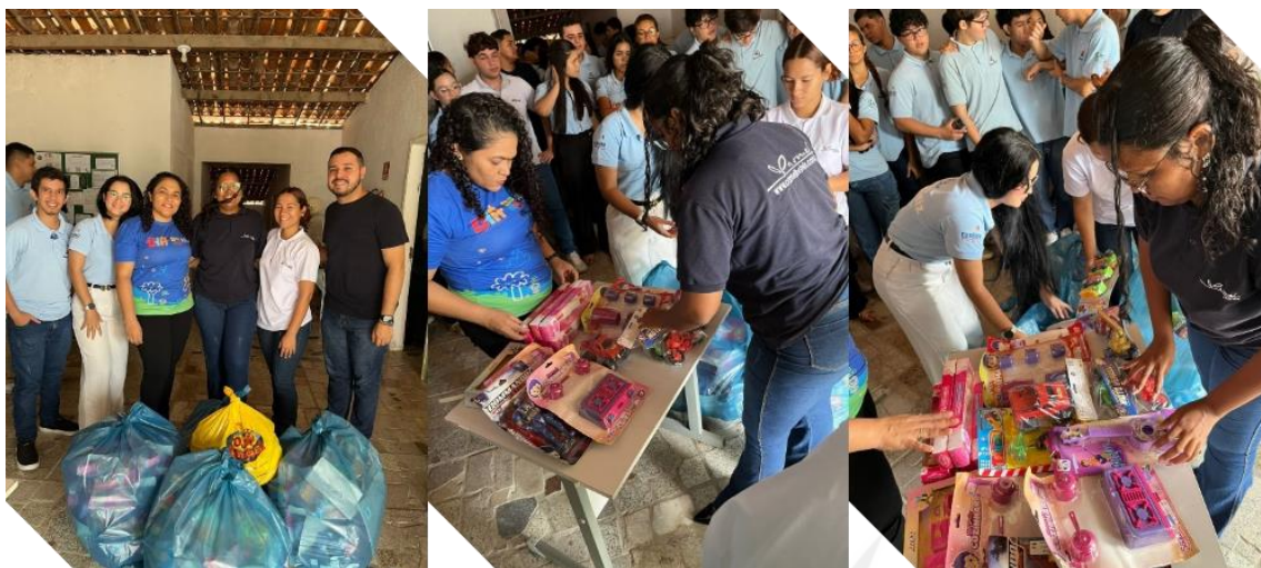
Fotos: Campanha de arrecadação de brinquedos no IEP Aquiraz.