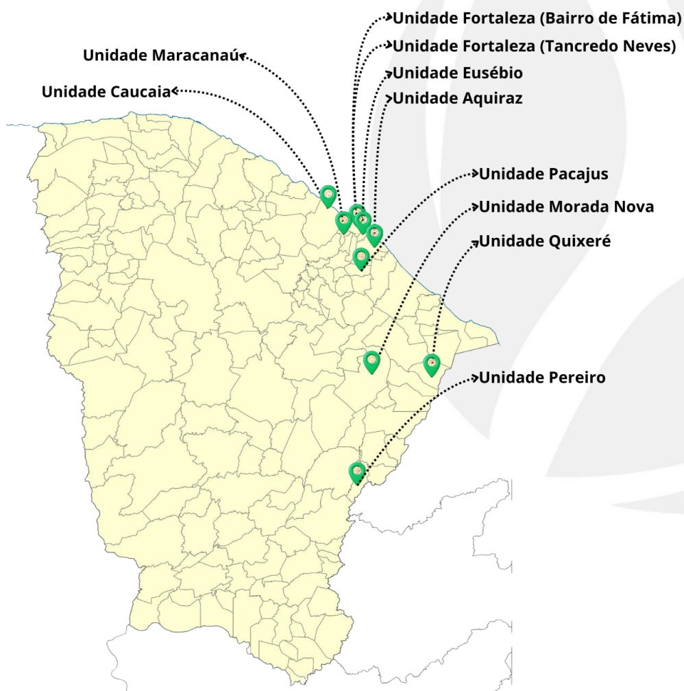
Figura: Mapa dos núcleos do IEP no Ceará.