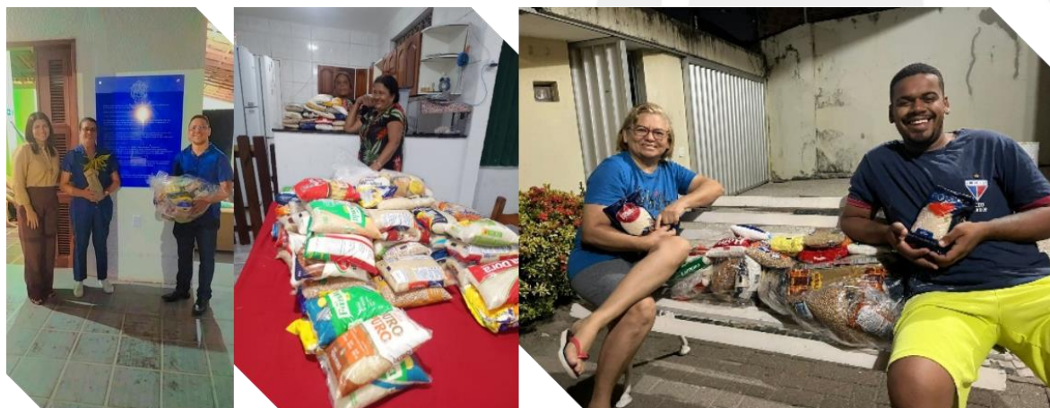
Fotos: Doação de alimentos arrecadados no Fórum IEP de Sustentabilidade.