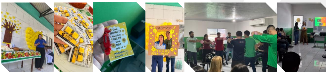
Fotos: Ações realizadas nas unidades do IEP.