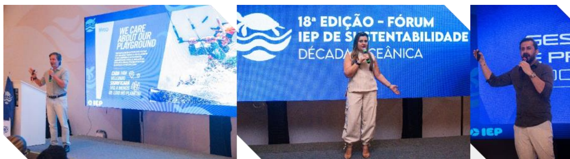
Fotos: Palestras no Fórum IEP de Sustentabilidade.

O Otimista: https://www.tapisrouge.com.br/forum-iep-sustentabilidade-reune-grandes-convidados-para-debater-a-decada-dos-oceanos-no-riomar-fortaleza/ Site RioMar: https://riomarfortaleza.com.br/novidades/riomar-fortaleza-recebe-18o-forum-iep-de-sustentabilidade