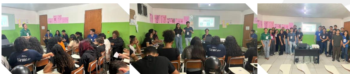
Fotos: Palestra ministrada aos adolescentes participantes do Projeto Educação Profissional Sustentável, no município do Eusébio.

O projeto, mais do que informar, buscou formar, contribuindo para o desenvolvimento integral dos adolescentes e para a promoção de uma cultura de saúde, respeito e cuidado mútuo.