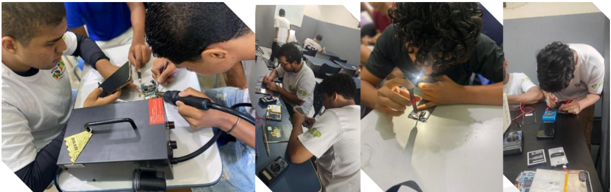
Fotos: Curso de Conserto e Manutenção de Celular.