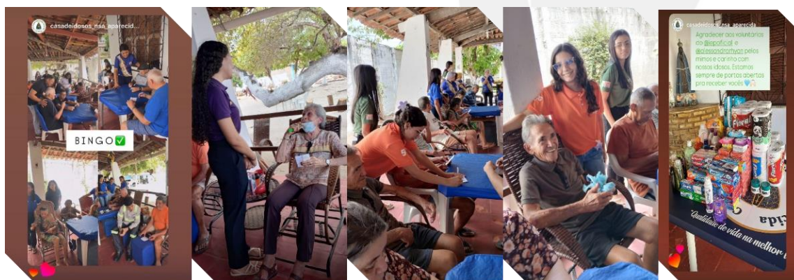
Fotos: Ação no lar de idosos nossa senhora aparecida em Caucaia.

A iniciativa reforçou a importância do respeito, da solidariedade e do cuidado com a pessoa idosa, tornando-se uma vivência significativa e enriquecedora para todos os envolvidos.