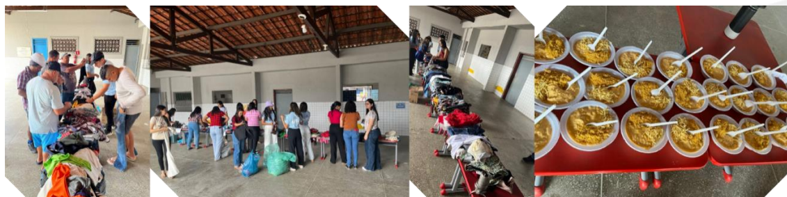
Fotos: Ação na escola Laís Sidrim em Aquiraz.

A iniciativa promoveu não apenas o acesso a itens de necessidade básica, mas também momentos de interação, solidariedade e socialização, reforçando o papel transformador da juventude no enfrentamento das desigualdades sociais. A ação também foi uma oportunidade prática para que os jovens colocassem em prática valores de empatia, cidadania e responsabilidade social, demonstrando o compromisso da turma com o cuidado ao próximo e o desenvolvimento comunitário