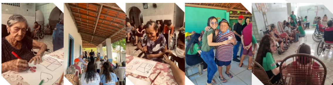
Fotos: Ações com idosos.

Essas ações, realizadas de forma planejada e sensível, reforçam o compromisso do IEP com a formação cidadã, a inclusão social e a construção de uma sociedade mais justa e humana, onde todas as gerações aprendem juntas e se fortalecem mutuamente.