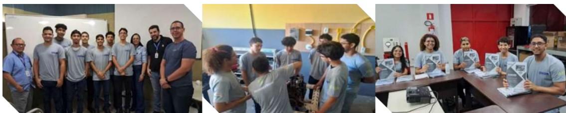
Fotos: Formação do curso.