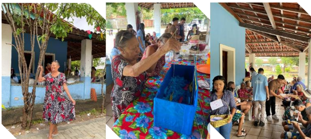
Fotos: Ação com os idosos em Aquiraz.

A Turma ADM 38 realizou, no dia 7 de julho, na Escola Laís Sidrim, mais uma ação social voltada para as famílias em situação de vulnerabilidade social de Aquiraz. Através da realização de um bazar solidário, os educandos mobilizaram a comunidade e os familiares na arrecadação de roupas e calçados que foram organizados e disponibilizados gratuitamente para as famílias atendidas.