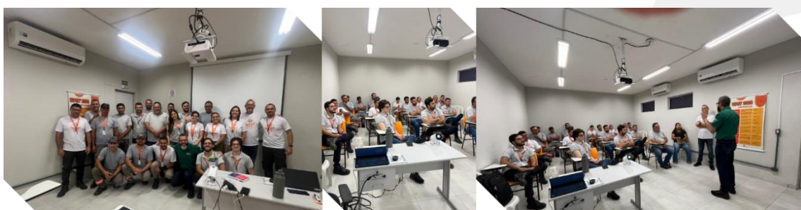
Fotos: Treinamento realizado na empresa T-Engenharia.

Contamos com uma plateia de 24 pessoas, e elas receberam instruções a respeito de Conflitos Geracionais, Flexibilização é uma Conquista e por fim, Tradicional Sempre, Arcaico Jamais.