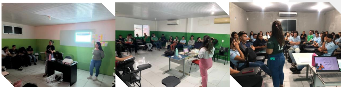
Fotos: Ações da Rato da saúde mental.

25/08/2025- Caucaia- “Os prejuízos da dependência emocional nas habilidades sociais” - ADM 28