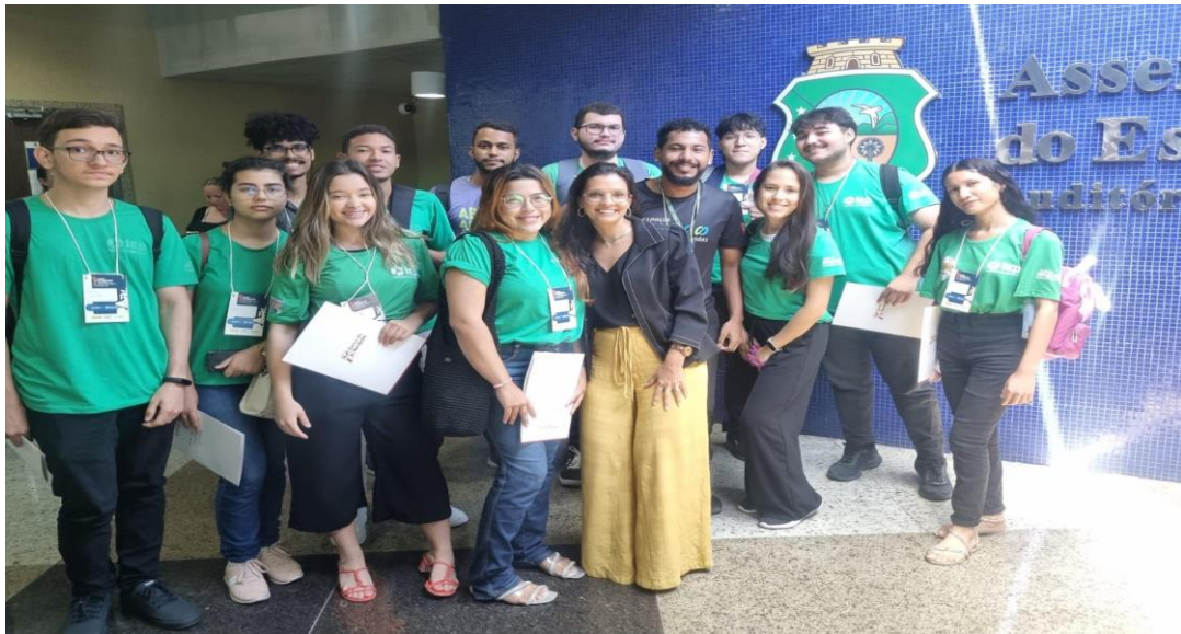
Turma: ADM 45

Feira Cearense de Aprendizagem Profissional do Ceará