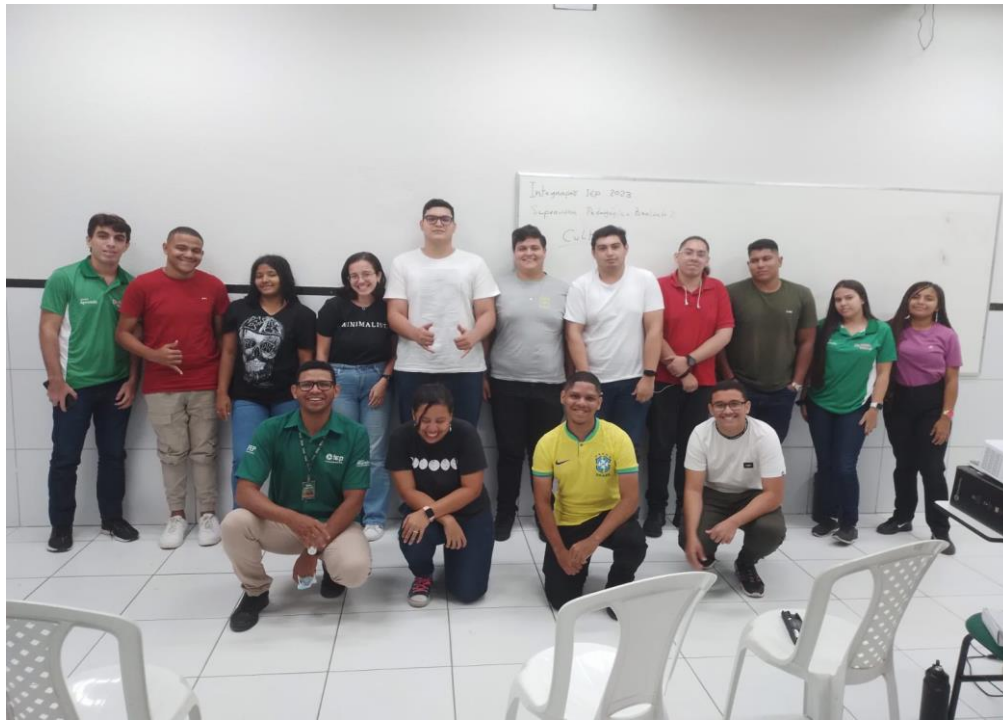
30 jovens integrados na cultura IEP