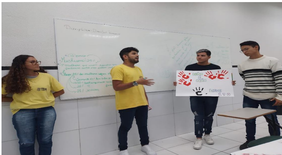
Turma ALP 01 – Carnaval consciente.