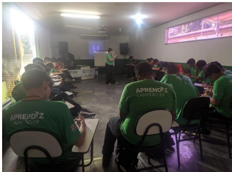
Turma: COMÉRCIO 05