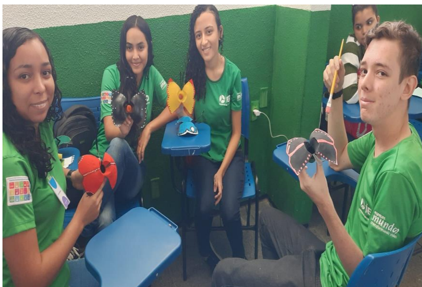
Turma: COSTURA 10

Disciplina: Preservação do equilíbrio do meio ambiente