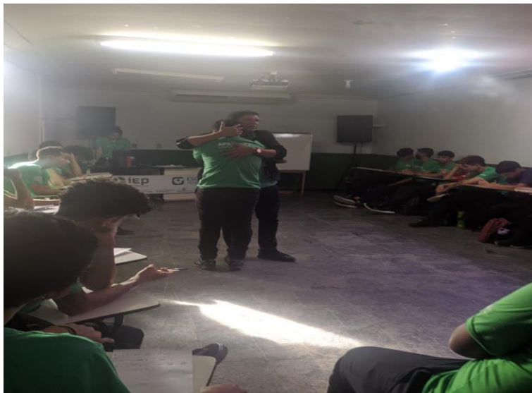
Turma: COMÉRCIO 05