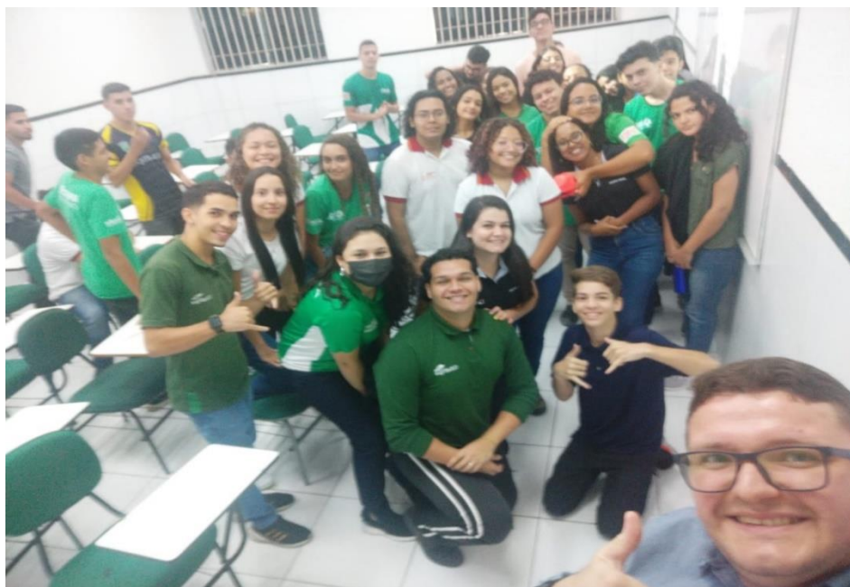
Momento de integração com os jovens