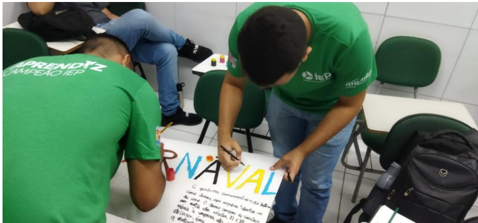
Turma ADM 48 – Produção de cartazes de conscientização sobre o período do carnaval.