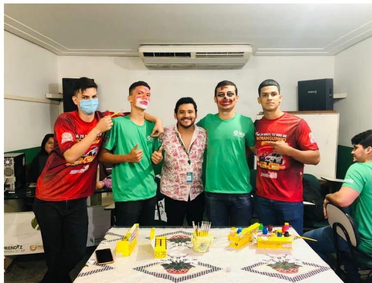
Turma: COMÉRCIO 06