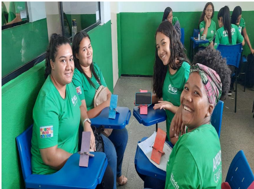
Turma: COSTURA 10