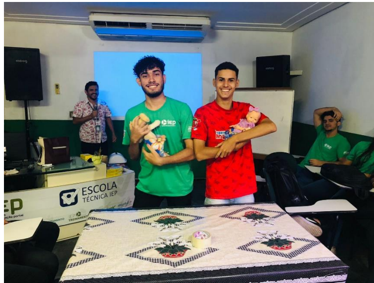
Turma: COMÉRCIO 06 E ADM 19