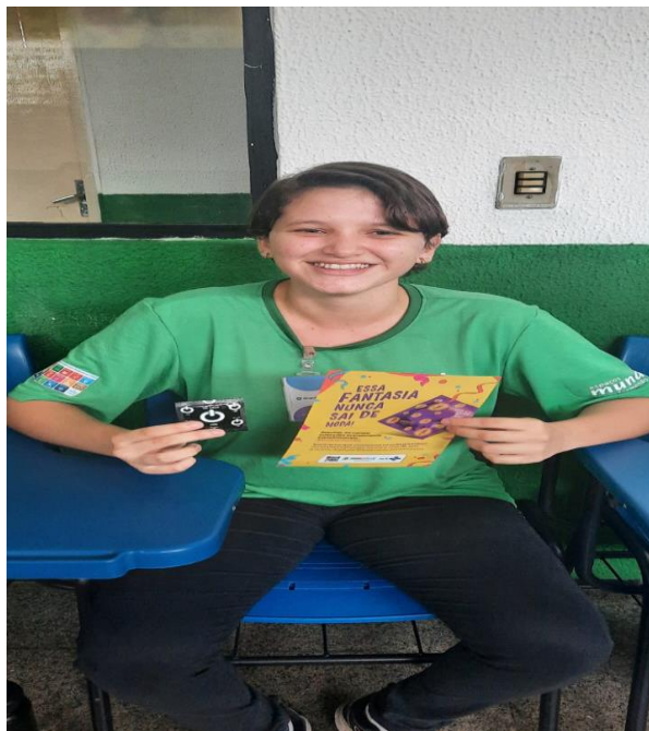
Turma: COSTURA 10