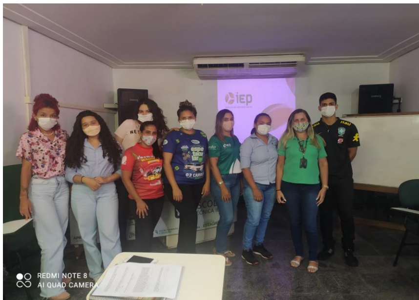
INTEGRAÇÃO REALIZADA DIA 22/11/2022