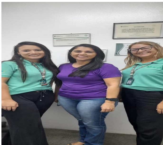
Visita a empresa TBM