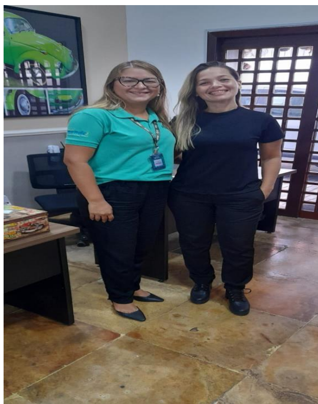
Visita a empresa XM Locações