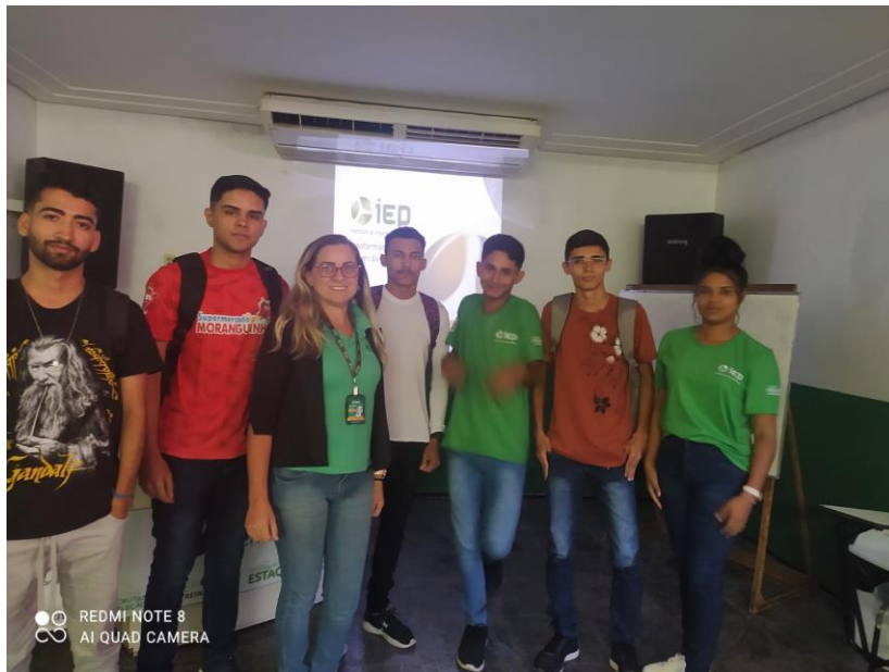
INTEGRAÇÃO REALIZADA DIA 01/11/2022