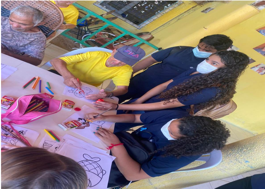
Turma: ADM 19

Objetivo: Proporcionar alegria para os idosos da casa do idoso de Horizonte. Entrega de cestas básicas, sorteio de brindes e brincadeiras.