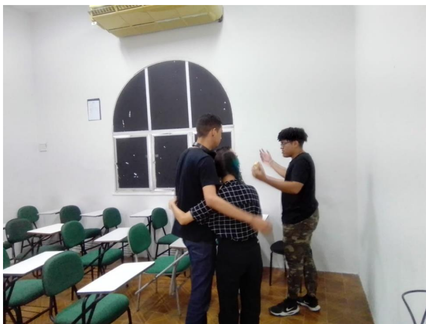
Realização de atividade da Tecnologia Espaços Mundos