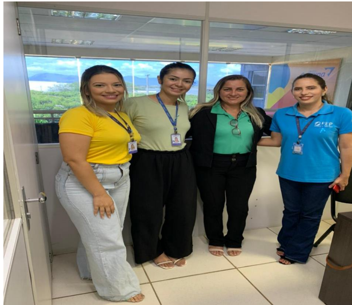
Visita a Empresa Ibiapina