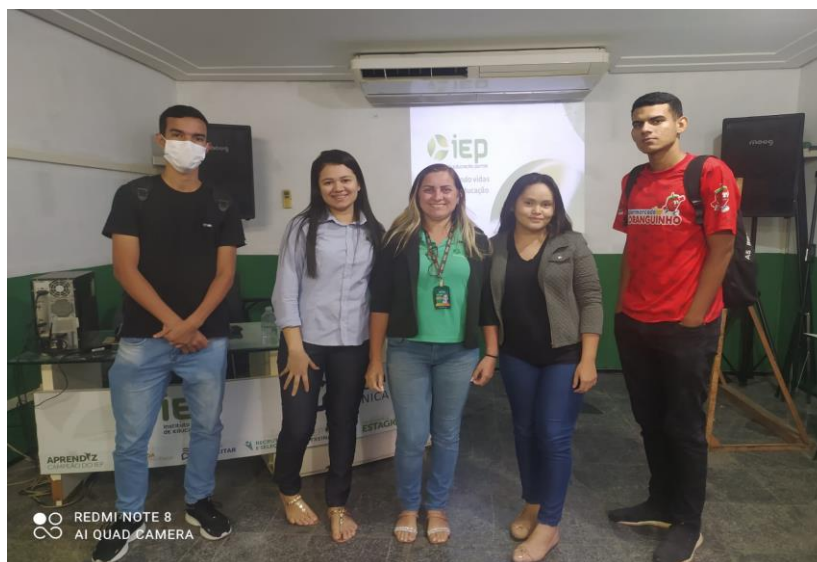
INTEGRAÇÃO REALIZADA DIA 14/11/2022