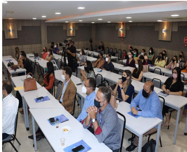
Convidados do Fórum IEP de Sustentabilidade