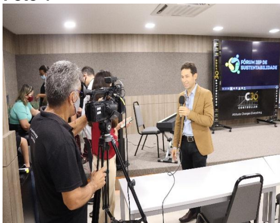
TV Otimista – fazendo a cobertura do Fórum IEP de Sustentabilidade.