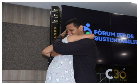
Apresentação Cultural – Tecnologia Social Espaços Mundos do IEP.