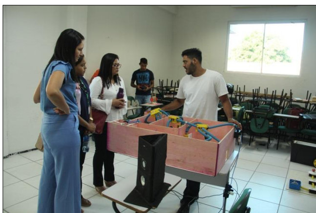
Foto 15 – Apresentação dos Projetos pelos Educandos - Projeto Makers para Instituição de Ensino.