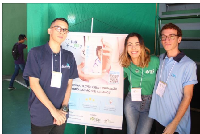
Foto 16 – Apresentação dos Projetos pelos Educandos – Projeto CLICK MED.