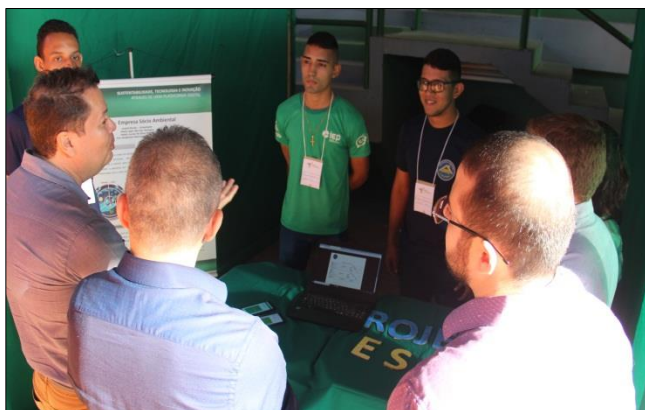
Foto 11 – Apresentação dos Projetos pelos Educandos – Projeto ECO ESA.