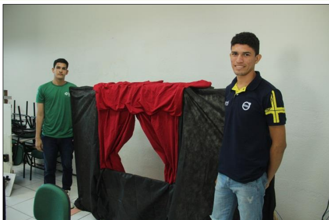
Foto 13 – Apresentação dos Projetos pelos Educandos – Projeto Makers para Instituição de Ensino