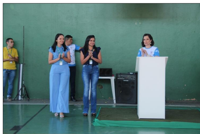
Foto 6 – Apresentação da Equipe Pedagógica da Educação Profissional do IEP.