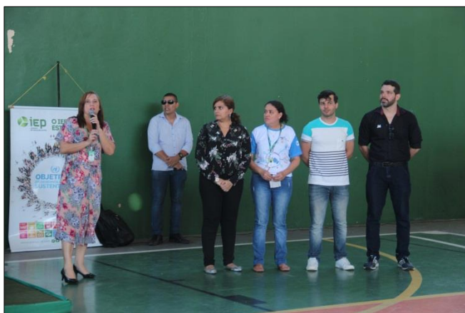
Foto 3 – Vice-Presidente do IEP apresentando os Professores e seus projetos.