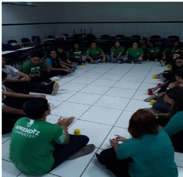
Trabalhando organização, direção e controle