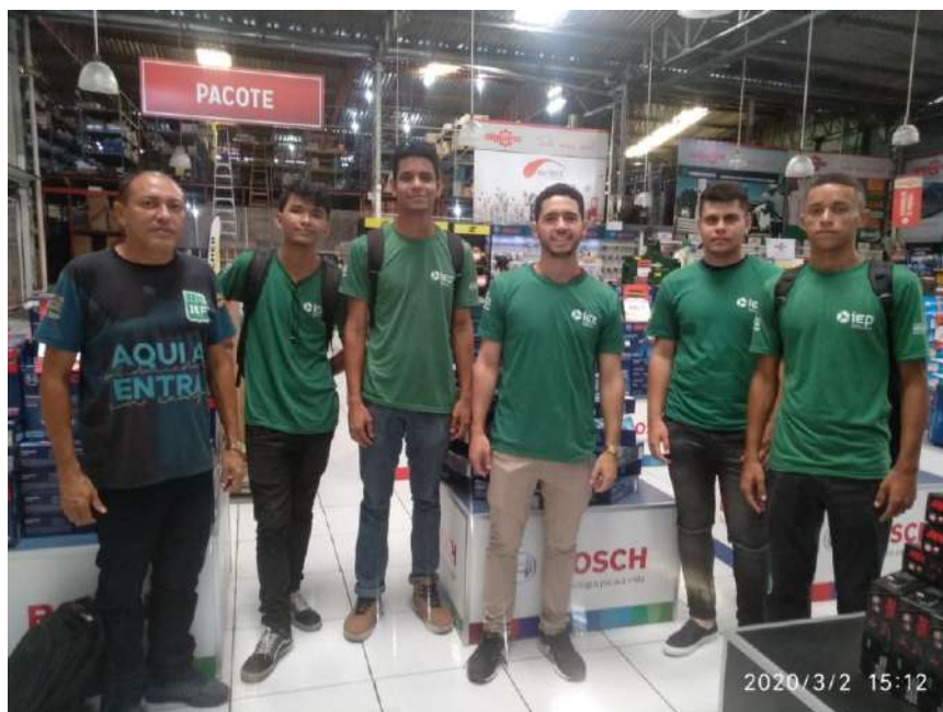
Visita a APIGUANA, aprimorando o conhecimento sobre materiais e equipamentos utilizados na construção civil.