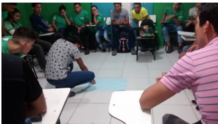
Compartilhamento de situações que interferem a nossa inteligência emocional

No dia 22.02 refletimos sobre as pessoas que nos inspiram. Cada educando citou personalidades que, para ele, servia de inspiração na vida e o porquê. Em seguida, com o objetivo de buscar inspiração em nós mesmos, cada educando registrou através de desenhos etapas marcantes de sua vida, como infância, adolescências, perdas e conquistas. Após o compartilhamento dos desenhos a turma foi dividida em duplas e cada jovem selecionou da vida do colega um fato marcante que mais lhe chamou a atenção. Esse fato serviu de base para a escrita de uma história inspiradora, baseada na vida real de seu colega. A atividade rendeu boas histórias de superações e conquistas. No final da atividade refletimos sobre a importância que deveríamos dar às nossas vidas e daqueles que nos rodeiam, pois cada um de nós temos boas lições de vida para ensinar a alguém, e que não apenas as personalidades públicas podem servir de inspiração para nós.