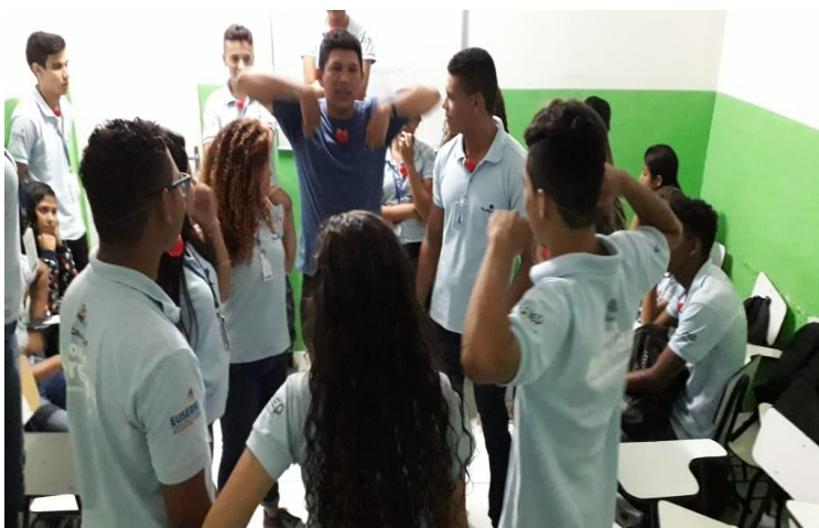
(Jogos cooperativos - Liderança Estratégica – concentração)