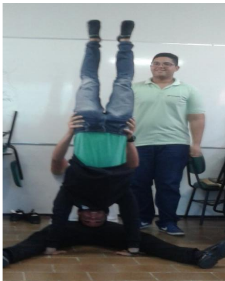
(Brinquedos acrobáticos - Liderança Estratégica – concentração)

aprimoramento comportamental resultou significativamente.