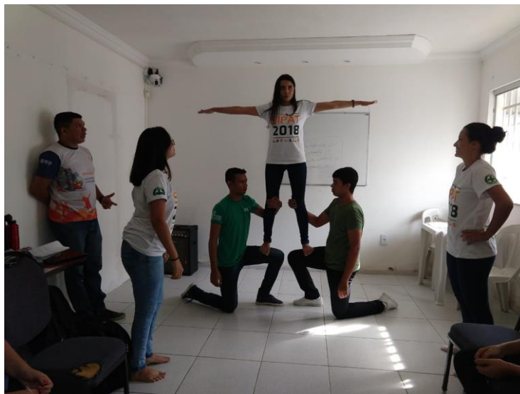
(Brinquedos acrobáticos - Liderança Estratégica – concentração)