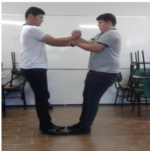
(Jogos cooperativos - Liderança Estratégica – concentração)