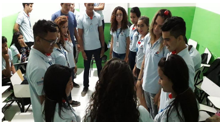
(Jogos cooperativos - Liderança Estratégica – concentração)

Resultamos em jovens mais preparados, conscientes que o empenho coletivo promove resultados significativos.